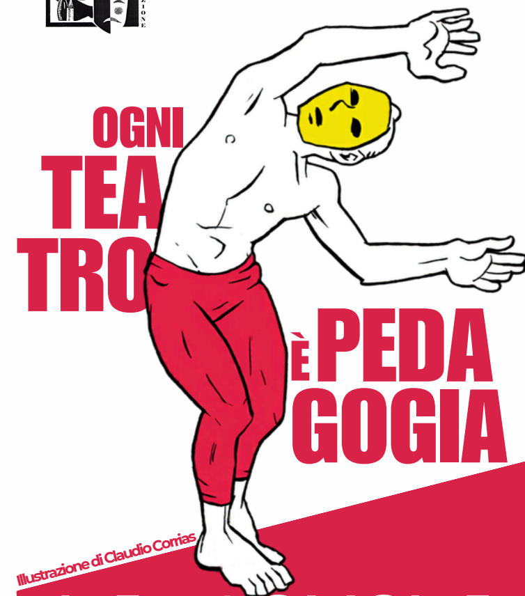
Illustrazione di Claudio Comias